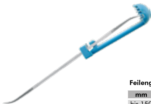
Feilengriff aus Kunststoff für Riffelfeilen